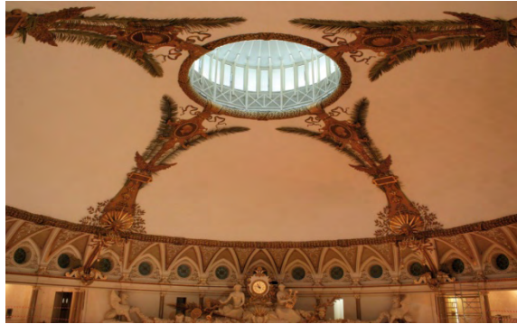
Com'è ora la controcupola

Sulla struttura portante in legno è stata ancorato la speciale rete portaintonaco STUCANET S , sulla quale sono stati applicati gli speciali intonaci antincendio SIGMATIC IGNIFUGO M 120 e IGNIVER , che offrono idonea protezione dal fuoco della struttura , in linea con le attuali norme vigenti sulla sicurezza.