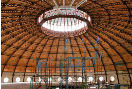
La fase di restauro della controcupola

L'imponente cupola esistente del Teatro è stata rivestita con una struttura progettata ad hoc per assicurarne una protezione idonea dal fuoco e la giusta correzione acustica della sala.